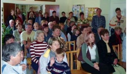
deti zo ZŠ a MŠ navštívili program pre svojich rodičov a starých rodičov

Vám, ktorým sa vlasy striebria a občas vráska sa do čela vryla, Vám sa chceme prihovoriť. Dôvod je prozaický - október - mesiac úcty k starším. Sami určite cítite, že žijeme rýchlo, z medziľud-