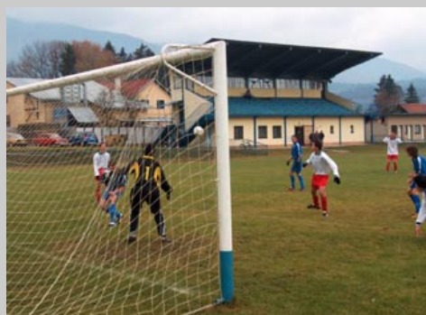
dorastenci v zápase s Necpalmi. Víťazne ladené mužstvo domácich nakoniec uhralo remízu 1:1