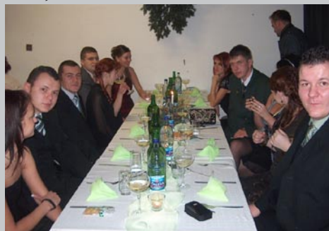
stól organizátorov poľovníckeho plesu

„Ples podľa mňa prebehol na vysokej úrovni a vydaril sa. Byť poľovníkom však nie je len o zábave a strielani, ale aj úcte k prírode, krmení, starostlivosti a zvelaďovaniu zvery.“